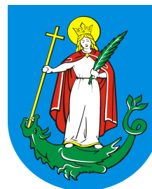
Urząd Miasta Nowego Sącza